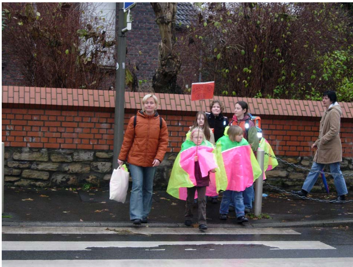
„Walking Bus“ an der Mörike-Grundschule

In Nordrhein-Westfalen haben sich der „Runde Tisch zur Prävention von Kinderunfällen“ der Stadt Dortmund und der dortige Kinderschutzbund zum Thema „Walking Bus“ engagiert. Derzeit gibt es insgesamt fünf „Buslinien“ die täglich laufen. An der Mörike-Grundschule im Stadtteil Lütgendortmund gibt es drei „Buslinien“. 2003 wurde dort die erste Aktion gestartet, die bis heute anhält.