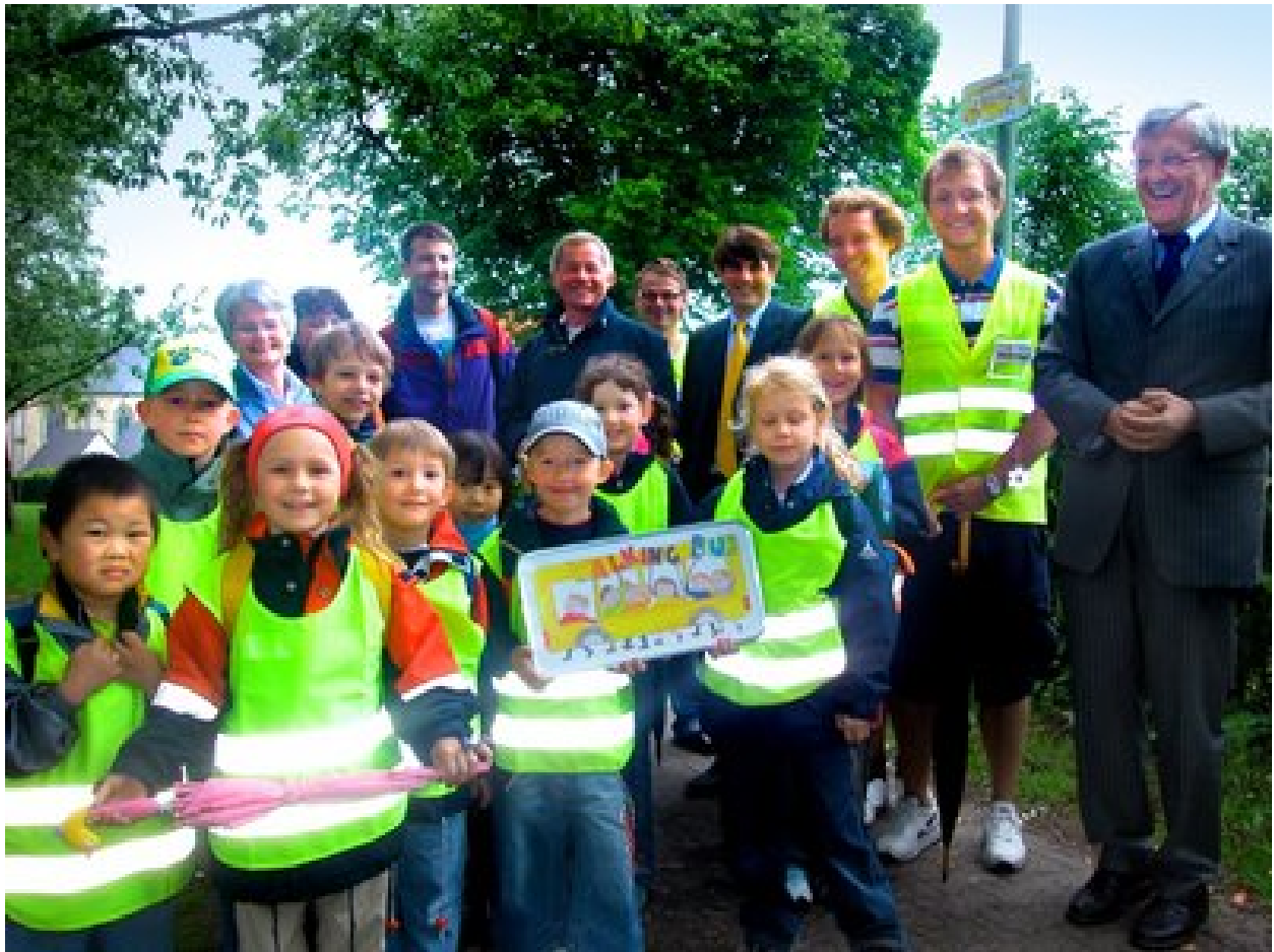
„Walking Bus“ an der Margarethengrundschule Dahl Paderborn.

Bewegung und Kommunikationsmöglichkeiten auf dem Schulweg zu mehr Konzentration im Unterricht führen. Auch hoffen die Wissenschaftler darauf, nachweisen zu können, dass Kinder durch die Bewegung am Morgen, auch am Nachmittag aktiver werden.