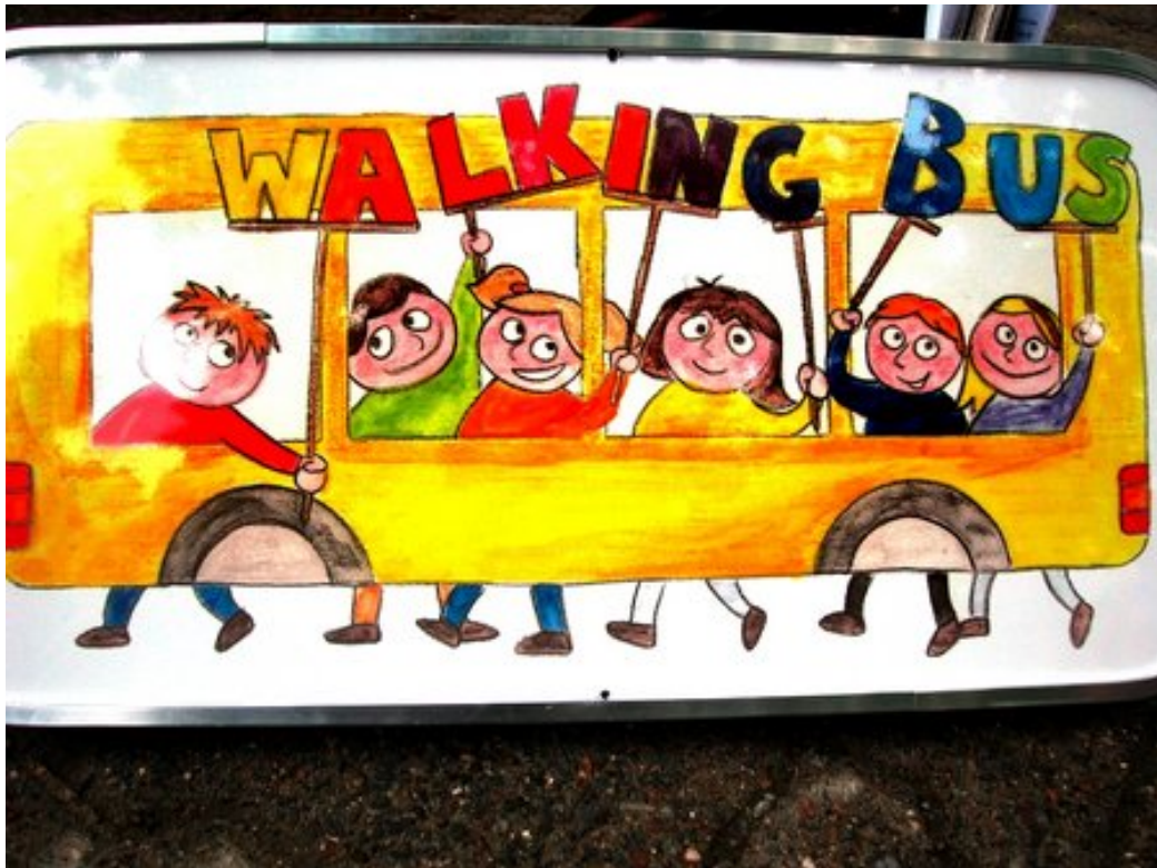
Beispiel eines Haltestellenschildes in Paderborn

Dieses Haltestellenschild kann z.B. an Laternen angebracht werden. Sinnvoll ist es selbstverständlich, die Kinder bei der Organisation des „Walking Bus“ einzubeziehen. Sie könnten das Logo für „ihren“ Bus entwerfen, die Haltestellen selbst festlegen, die Haltestellenschilder malen, Schilder für die Fahrerinnen und Fahrer, Schaffnerinnen und Schaffner und Kontrolleurinnen und Kontrolleure entwerfen. Auch mögliche Aktionstage sollten immer unter Beteiligung der Kinder entwickelt werden.